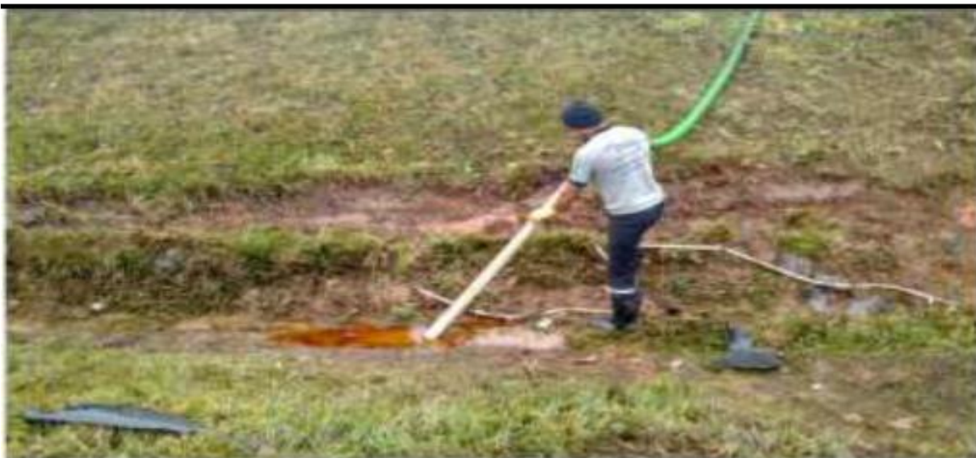
Sucção do resíduo