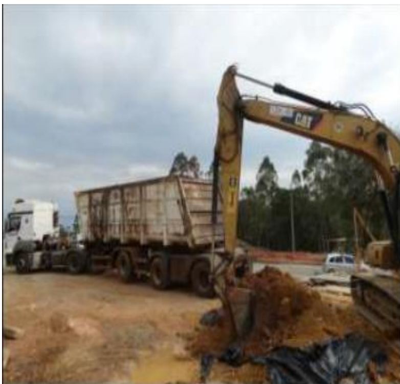
Limpeza da área