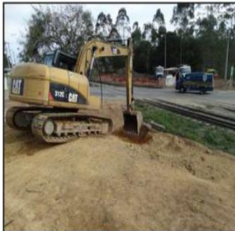
Limpeza de barranco