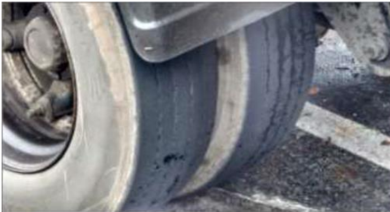
Estado dos pneus do veículo