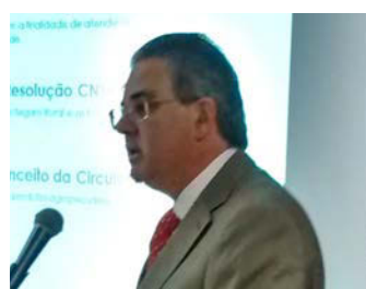
Seguro Rural Wady Cury (BB Mapfre)