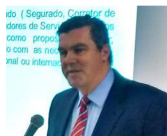
Transportes Paulo Robson Alves (Zurich Minas Brasil)