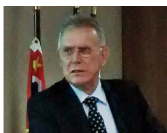
Habitacional Eduardo Brito (Caixa Seguradora)