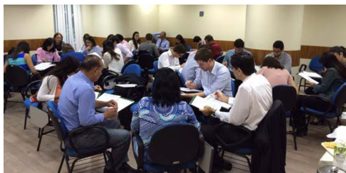
O workshop teve a participação de 24 pessoas, em São Paulo (à esquerda), e de 35 pessoas, no Rio de Janeiro