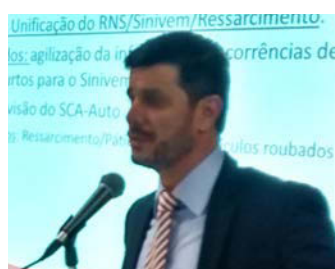
Automóvel Eduardo Dal Ri (SulAmérica)

Durante o II Encontro das Comissões Técnicas da FenSeg, realizado no auditório do Sindseg SP, no dia 7, os presidentes das Comissões Técnicas e os coordenadores das Subcomissões da Federação relataram as atividades que vêm desenvolvendo, para maior sinergia entre os segmentos.