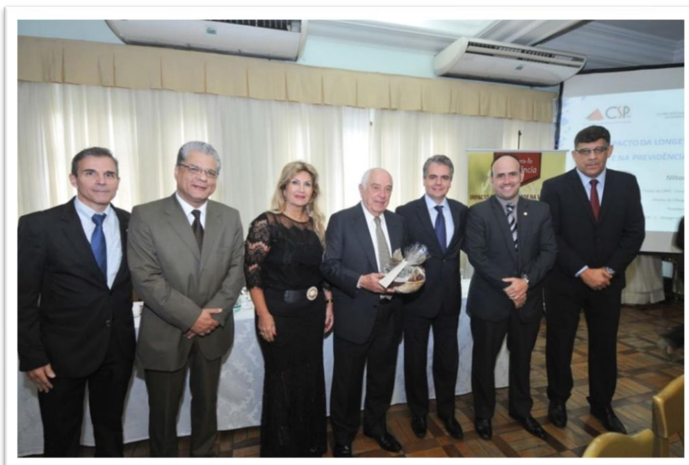
Almoço Palestra realizado no dia 4 de outubro, em Belo Horizonte, pelo Clube de Seguros de Pessoas de Minas Gerais (CSP-MG) e pelo Clube dos Corretores de Seguros do Estado de Minas Gerais (ClubCor-MG).