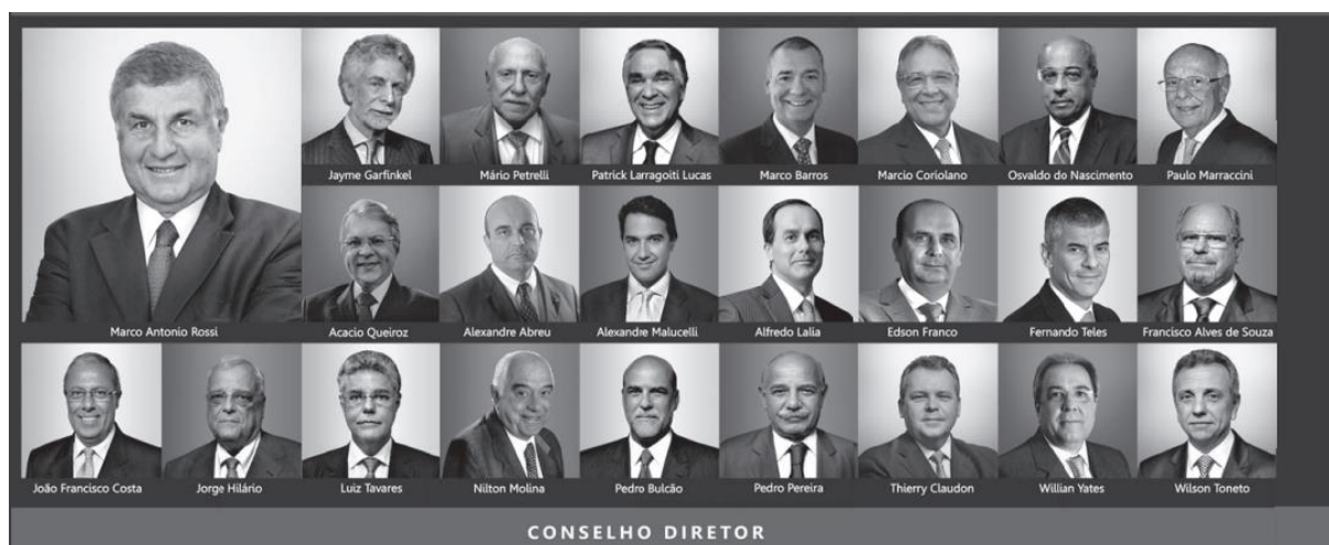
Foto reprodução do Informe Anual do Mercado Segurador Brasileiro 2014.