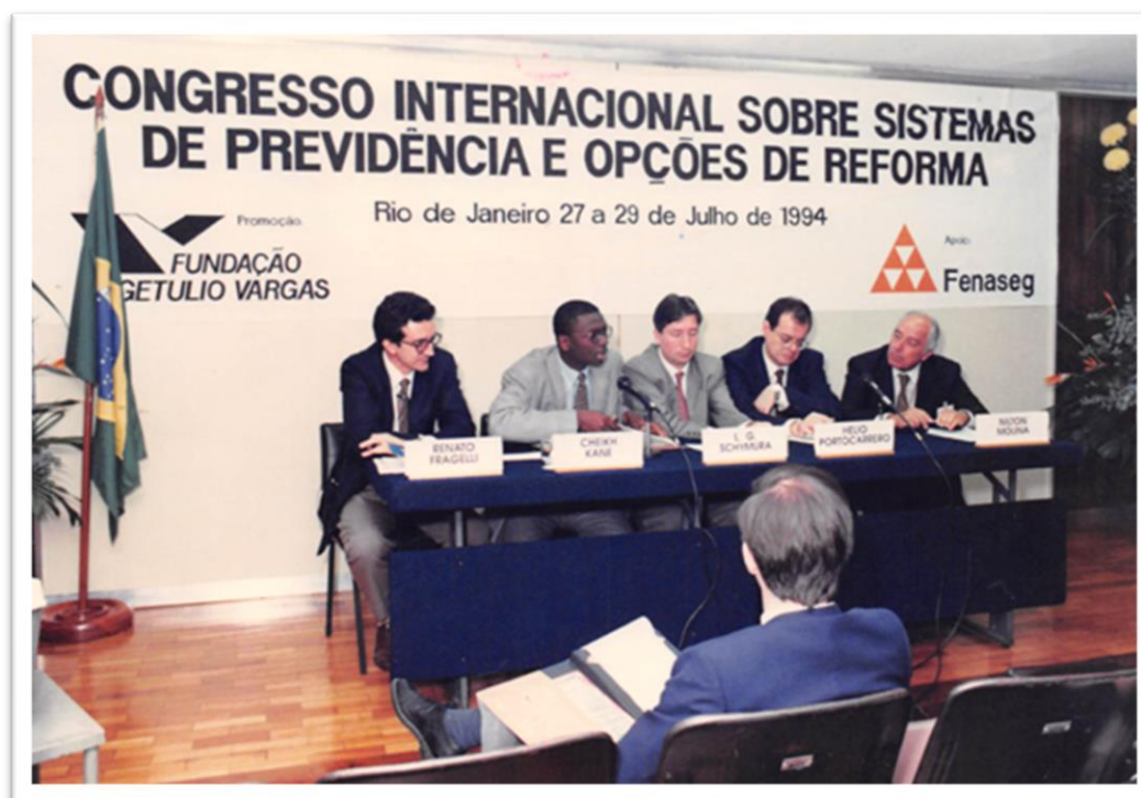
Congresso Internacional sobre Sistemas de Previdência e Opções de Reforma.