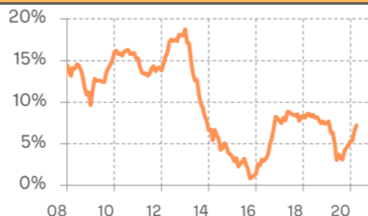
Crescimento de prêmios emitidos de seguros