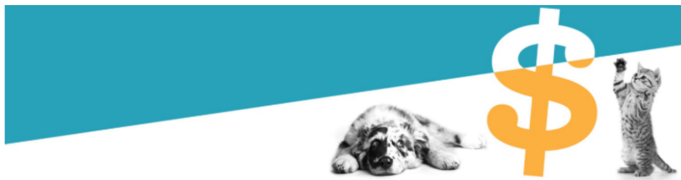
In-Force Gross Written Premium (GWP) North America (in USD)