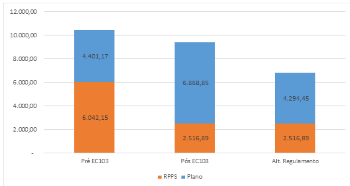
Gráfico 2: Pensão por morte na Funpresp e no RPPS - valores em R$

Em relação à pensão por morte, para um participante com salário médio mensal de R$ 10 mil e considerando a fórmula de cálculo proposta, teríamos: