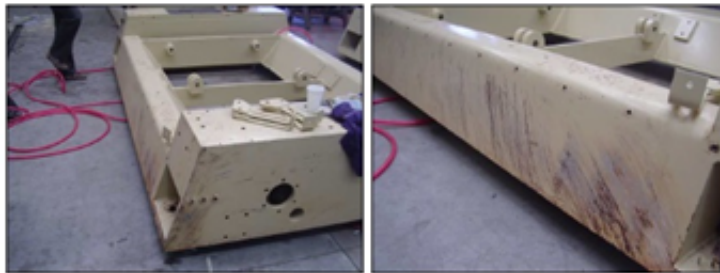
Rolo Laminador novo para comparação: