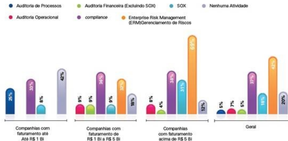
Algumas das atividades abaixo são realizadas por outras áreas em sua empresa que não seja a de Auditoria Interna?

Outro item a se destacar com maior relevância é que nas companhias com faturamento superior a R$ 5 bilhões as atividades de Gerenciamento de Riscos não são realizadas pela área de auditoria interna, mas em outras áreas independentes.