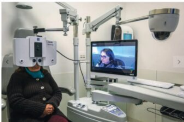
Paciente passa por consulta oftalmológica em Porto Alegre em programa de medicina a distância