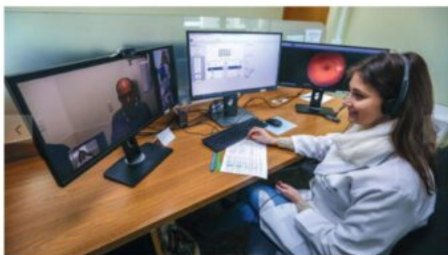
Central de atendimento remoto na sede do programa, também em Porto Alegre