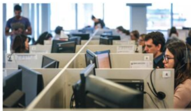
Central de atendimento remoto na sede do programa, também em Porto Alegre

Além do apoio à telemedicina, a AMB defende o que chama de liberdade territorial para a atuação médica. De acordo com o entendimento da entidade, médicos não devem ser impedidos de realizar atendimentos virtuais a pacientes localizados em outros estados. A associação ainda pede que não seja exigido registro em conselhos regionais de medicina de outras regiões para atendimentos desse tipo.