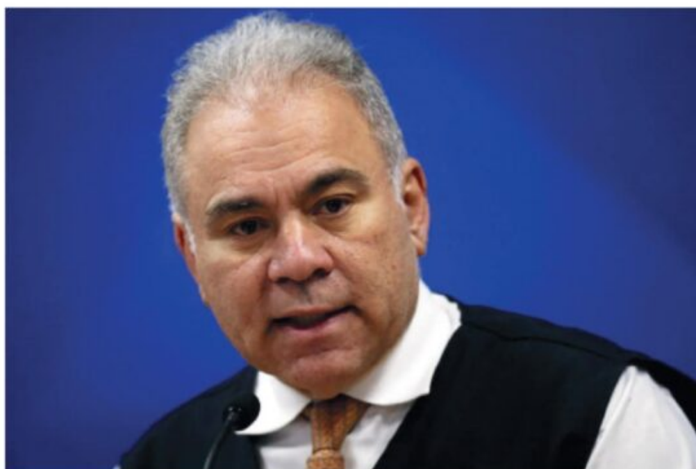
O ministro da Saúde, Marcelo Queiroga - Adriano Machado - 18.abr.2022/Reuters

A Associação Médica Brasileira (AMB) endossou nesta segunda-feira (18) a decisão do ministro da Saúde, Marcelo Queiroga, de reeditar a portaria que permitiu a realização de consultas e diagnósticos a distância no Brasil depois da explosão da epidemia do coronavírus. A informação foi antecipada pela coluna.