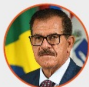
Ministro Humberto Martins Presidente do STJ