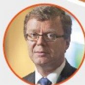
Ministro Paulo de Tarso Sanseverino Superior Tribunal de Justiça