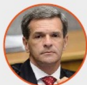
Ministro Marco Aurélio Bellizze Superior Tribunal de Justiça