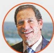
Ministro Luis Felipe Salomão Superior Tribunal de Justiça