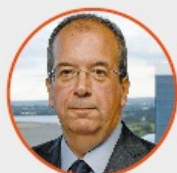
Ministro Ricardo Villas Bôas Cueva Superior Tribunal de Justiça